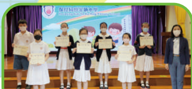
第十七屆小學生中英文現場寫作比賽 中文優異獎