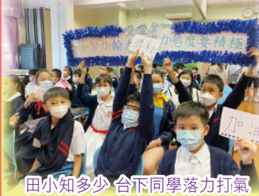
田小知多少 台下同學落力打氣