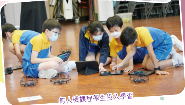
無人機課程學生投入學習