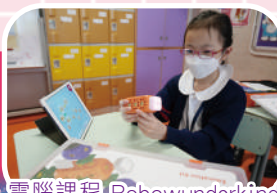
電腦課程 | Robowunderkind

四至六年級計算思維課程、跨科目專題研習、Code Monkey編程自學平台及資優課程（3D打印、VR動畫設計、人工智能、無人機編程）、STEM Day、創科@大埔機械人課程、電車廠參觀及電車模型STEM課程、校外比賽（TVB Robo Cup、Lego Technic之最、Ozaria Shecreates遊戲關卡設計、Coding Olympics、國際青少年創科奧林匹克大賽）