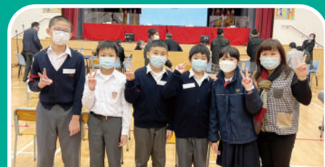
大埔區公民常識問答比賽 亞軍