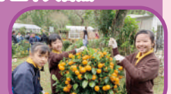
小女童軍義工服務