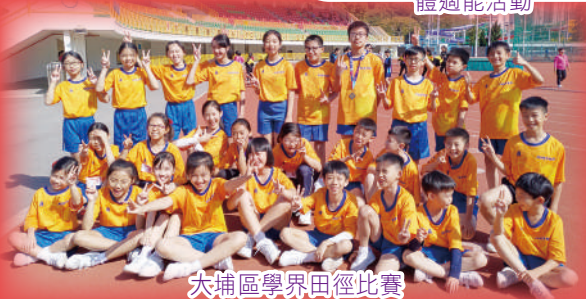
大埔區學界田徑比賽