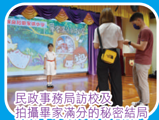
民政事務局訪校及拍攝畢家滿分的秘密結局