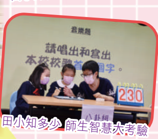
田小知多少 師生智慧大考驗