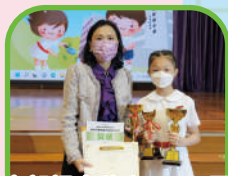
兒童朗誦大獎賽 2022亞軍 三級鋼琴獨奏第一名 Contest 2021- Piano Examination Grade 3銅獎