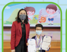
第九屆國際兒童及 青少年弦樂演奏比賽 網上最具人氣銀獎 榮譽獎