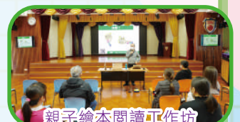
親子繪本閱讀工作坊

The Parent-Teacher Association (PTA) of the school was established in 1998 to promote closer links between parents and the school, and to foster a friendly partnership between the two parties. It also promotes a positive and healthy campus through parents-school cooperation. It is one of the school's precious resources. Parents actively participate in Parent Education seminars and workshops, continue to boost training; support students' studies and the techniques and knowledge for growth. Parents enthusiastically participate in school activities and parent volunteers participate as Lunch Volunteers, Parent Volunteers Story-telling, and in Library Duties, Joint-school Sports Day and Fun Day volunteers, off-campus visits and to-lead competitions, assist in major activities like Christmas Gathering, Teachers' Day, Old Uniforms Give-away, PTA picnic, Parent-child Film-watching, Alumni Banquet, providing huge human resources. Parents also represent the PTA committee through election, participate in meetings and organize activities, also assisting school to monitor and review school lunch, uniforms, textbooks and school bus provider's service quality. Through continuous close communication, parents and the school develop common belief, promote students' sense of belonging at school and enrich children's various learning experiences.