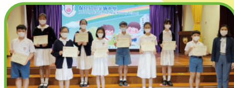
第十七屆小學生中英文現場寫作比賽 英文優異獎