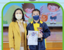
兒童權利公約 創意填色比賽 全港冠軍