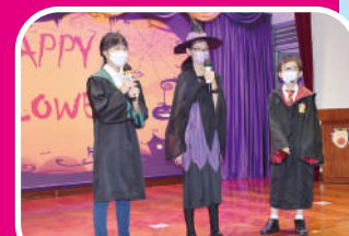
English Fun Day - Opening