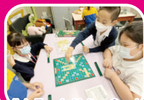
English Fun Activity - Scrabble

English Gurus, Read Write Inc. Programme, English Verse Solo Speaking Competition, Tin's Fruit, English Fun Activities, English Fun Day, English Class for Elite students, P.5 and P.6 Interview Course and Writing competitions.