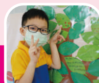
30 th Anniversary Celebration - Gratitude Tree