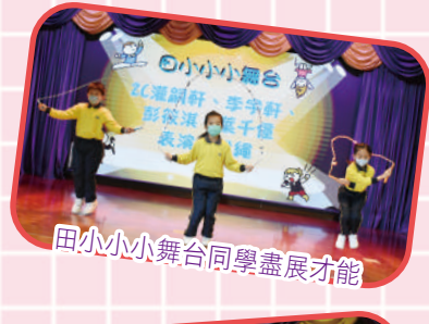
田小小舞台同學盡展才能