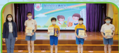
大埔區公民常識問答比賽 亞軍