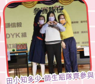
田小知多少 師生組隊齊參與