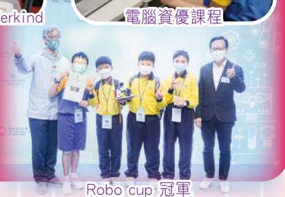
Robo cup 冠軍