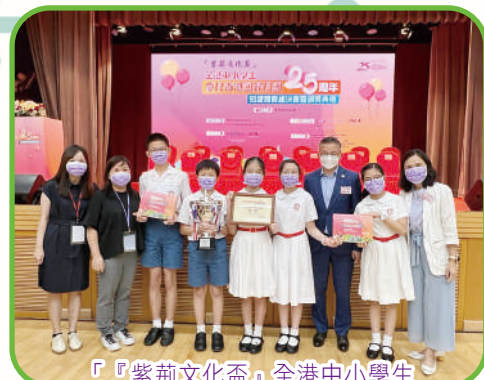
『紫荊文化盃』全港中小學生 慶祝香港回歸祖國25周年知識競賽 小學組亞軍