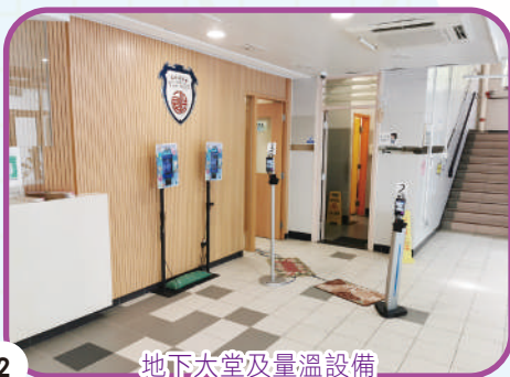
地下大堂及量溫設備

In order to enable students to learn in the best environment, our school improved the classroom equipment and technology last academic year and added built-in programs and interactive TV in each classroom to correspond with e-learning. Besides, an LED wall and stage lighting equipment were installed in the school hall. To fully utilize the campus space, the old school office was reconstructed to the multi-purpose room. Partitions were added to the hall, the covered playground and art room so that parts of the rooms can be separated easily for different activities. To guard against the epidemic, facial infrared thermometers were added to our school to check students' temperature more quickly and accurately.