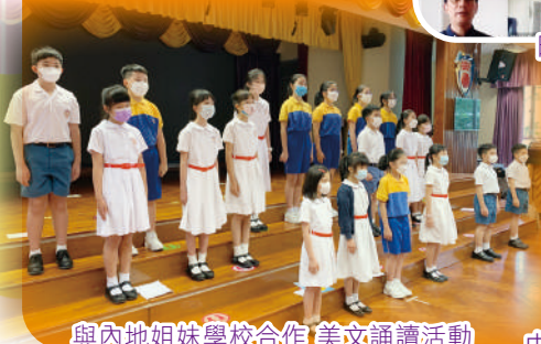
與內地姐妹學校合作 美文誦讀活動