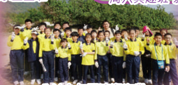
公益少年團清潔海灘