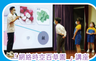
「網絡時空百草園」講座