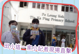
田小這一家小記者現場直擊