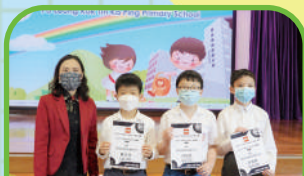
LEGO「TECHNIC之最」 比賽 季軍