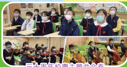
三十周年校慶主題曲合奏