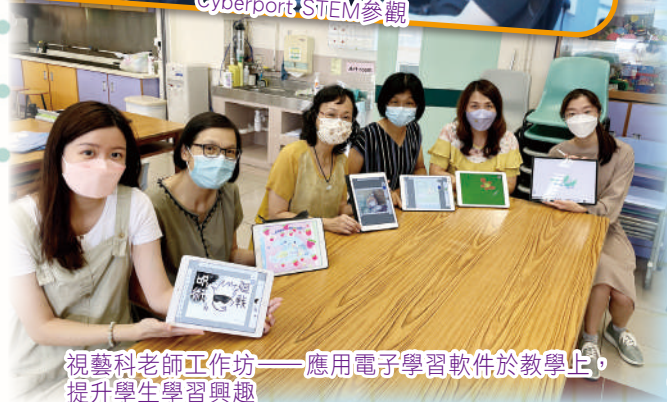
視藝科老師工作坊——應用電子學習軟件於教學上，提升學生學習興趣