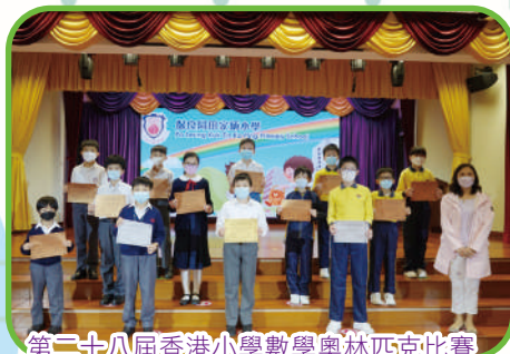
第二十八屆香港小學數學奧林匹克比賽