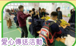
愛心傳送活動 校服轉贈給有需要的學生

田小家長教師會由1998年成立至今，一直以來都是學校和家長之間的重要溝通橋樑，而透過家校合作亦可促進建立健康校園。田小的家長一直是學校的好夥伴，是學校的寶貴資源。家長們積極參加親職教育講座和工作坊，不斷提升培育、支援學生學習和成長的技巧和心得。家長們也踴躍參加學校活動及擔任家長義工，包括午膳義工、家長義工講故事、圖書館館務、聯校運動會與同樂日義工、校外參觀和比賽帶隊、協辦大型活動，如聖誕聯歡會、敬師日、舊校服轉贈、家教會旅行、親子電影欣賞會、畢業生聚餐等，為學校提供了龐大的人力資源。家長更會參選成為家教會委員，參與會議及組織活動，並協助學校監察和檢討午膳、校服、書簿及校車供應商的服務質素。透過持續的緊密溝通，家長與學校建立起共同的信念，提升學生對學校的歸屬感，增潤孩子豐富多元的學習經歷。