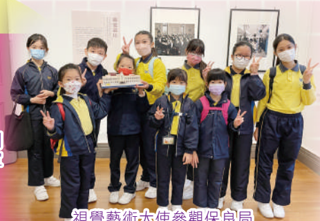
視覺藝術大使參觀保良局歷史博物館懷舊相片展覽