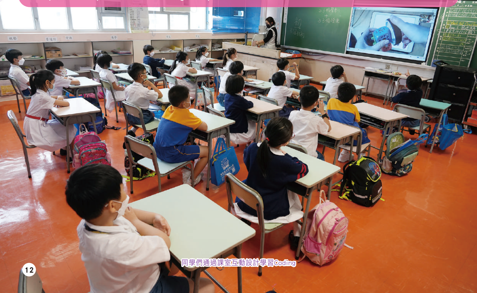
同學們通過課室互動設計學習Coding

Over the years, our school has been funded to enhance and improve the learning environment. The projects include Tin's Musiland, STEM Programme, school-based Computational Thinking Programme, etc. These programmes and plans have improved students' learning atmosphere and environment.