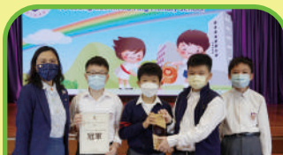
TVB Robo Cup機械人格鬥比賽 冠軍