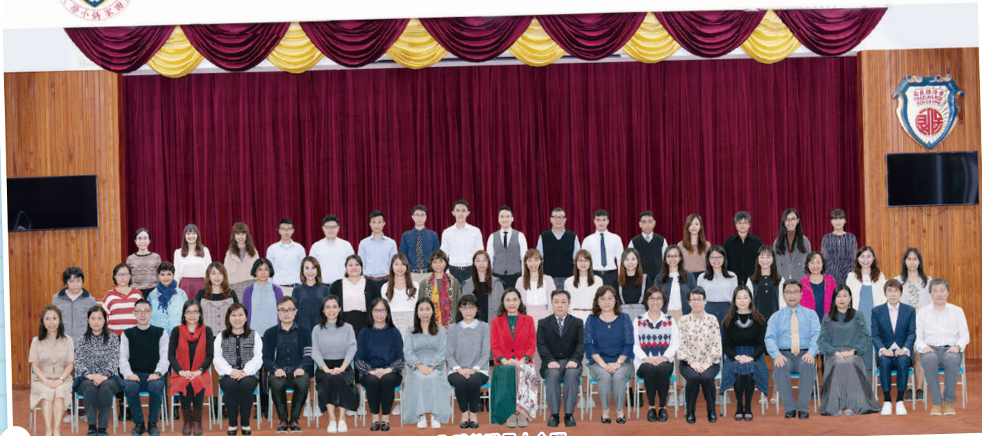
全體教職員大合照