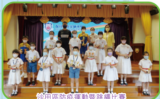
沙田區防疫運動暨跳繩比賽 全場學校成績總冠軍