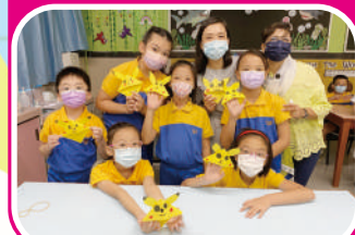
English Fun Activity - Pokemon Craft