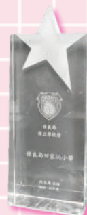
保良局傑出學校獎