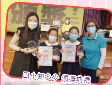
田小知多少 頒獎典禮