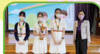
全港Rummikub聯校小學邀請賽 (分區)初賽 團體季軍