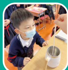
實驗進行中，細心觀察

時事多面體、科學小教室、筆記齊共賞、電子課業、見習工程師、小小工程師、班際公民常識問答比賽、水果月活動、綠化校園資助計劃、及跨科目專題研習。