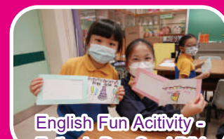
English Fun Activity - Father's Day Card DIY