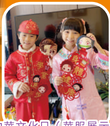
中華文化日 (華服展示)