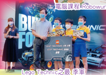
Lego Technic之最 季軍