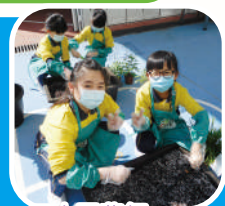
田小園藝師種植中醫藥植物

校長講故事、「一生一卡」計畫、「4·23世界閱讀日」校本活動、「網絡時空百草園」、「畢家滿分的秘密」、「三十周年校慶故事創作比賽」、「香港小學生書籤交換計劃」、「閱讀大挑戰」、「圖書伴讀計劃」、「篇篇流螢」網上跨課程廣泛閱讀計劃、「書唔兇」閱讀網站及「小校園」。