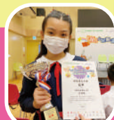
兒童權利公約創意填色比賽 冠軍