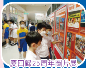
慶回歸25周年圖片展

升旗禮、2022「全民國家安全教育日」網上問答比賽、公民教育委員會親子雜誌「小泥子」、廉政公署「童·閱·樂」繪本傳承計劃、德育及國民教育頻道、糊塗戲班無障礙劇場、宣明會生命教育講座之貧窮人的寶藏、遊劇場生命教育巡迴劇之《喜跑線》、2021/22腦伴同行教育計劃《只要有愛，腦退化不可》木偶劇、百年歷史當代中國及璀璨香江慶祝香港回歸25周年圖片展、慶祝回歸25周年青少年畫作徵集活動。