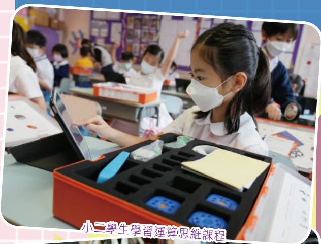
小二學生學習運算思維課程

本校致力為學生創造空間，培育學生全人發展。自2018年開始，推行三學段學制，旨在減少學生的測考壓力，同時亦讓學生有更多空間，發掘自己的興趣與潛能。另外，本校下午設導修課，讓學生於校內完成家課，從而拓展課餘的學習空間。為培育學生兩文三語的能力，從2009年開始小一至小四全面推行以「以普通話教中文」課程，藉此提升學生的中國語文及普通話的能力。而各科的課堂亦以小組「合作學習」的形式進行，激發學生的學習動機，提升學習效能。早於2016年，本校已於常識科的校本課程中加入STEM元素及思維能力的訓練，培養學生的分析及解難能力，亦培育其終身學習的態度，為未來的學習作裝備，期盼學生成為國家的棟樑。