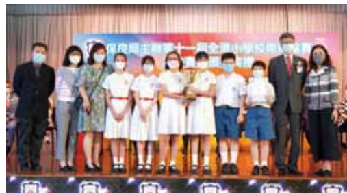
辯論隊取得全港小學校際辯論賽季軍

本校致力為學生創造空間，培育學生全人發展。自 2018 年開始，推行三學段學制，減少學生測考壓力，同時，讓學生能發展自己的興趣與潛能。另外，本校下午設導修課，讓學生於校內完成家課，拓展學習空間。為培育學生兩文三語的能力，從 2009 年開始小一至小四全面推行以「普通話教中文」課程，提升學生中國語文及普通話的能力。各科的課堂以小組「合作學習」，激發學生的學習動機。早於 2016 年，本校已於常識科的校本課程中加入 STEM 元素及思維能力的訓練，培養學生分析及解難能力，為未來的學習作裝備，培育終身學習的態度，期盼學生成為國家的棟樑。