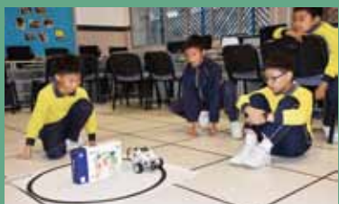
科學尖子練習情況