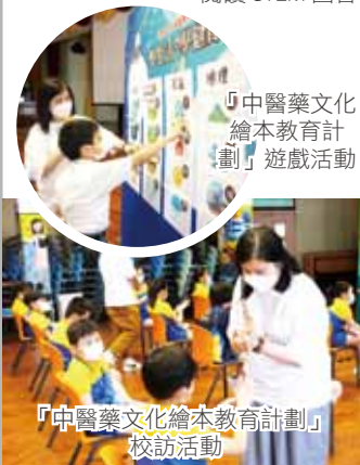
「中醫藥文化繪本教育計劃」遊戲活動