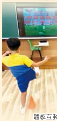
體感互動遊戲體驗