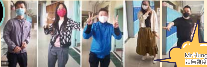
看看各位老師臉上勝利的笑容