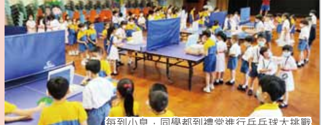
每到小息，同學都到禮堂進行乒乓球大挑戰