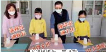
老師與學生一同挑戰