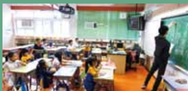
小小司儀班同學用心上課

本校選拔學習能力突出之學生額外接受「資優課程」，並計劃將資優教育推前化，由小一開始於校本課程中滲入全班式資優教育課程。語文方面，中文科選出語文能力優秀的學生參加「辯論隊」及「小小司儀班」，培養學生的口才及思辯能力；「English Gurus」訓練學生英語溝通能力，提升學生的閱讀興趣及技巧；「數學精英組」為數學方面有特出表現的學生進行培訓，發展他們在數學方面的潛能；常識科通過校本專題研習及參與不同的校外比賽，培育學生對科學的興趣，成為「STEM 科學尖子」的學生，更有機會參加不同的科學培訓班。藝術培育方面，本校也致力發展校本資優課程，視覺藝術科更選拔資優學生當「藝術列車」，讓學生發揮藝術潛能。學校在學科以外方面，亦舉辦不同的活動以提高學生的策劃和創作能力，提供機會讓他們展示潛能，如「校園電視」活動，學校選拔有才能的學生拍攝學校活動，並製作成短片，培養他們組織及策劃能力；學校更設立話劇組，為對戲劇有興趣及潛質的學生提供學習及發揮的機會，讓他們學習創作和演藝才能。