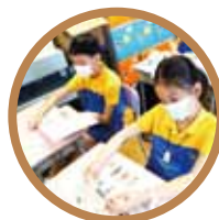
《清宮科普大作戰》故事劇場及延伸科普活動