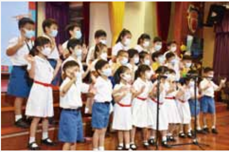
校內音樂比賽為一年一度的學校盛事，同學踴躍參加比賽，發揮所長。

本校學生踴躍參與校內及校外的音樂活動，校內舉辦的音樂活動包括中、西樂器班、管樂隊、中樂隊、節奏樂隊、弦樂隊、歌詠隊及管樂雅舍。各校隊成立多年，積極參與各項比賽。學生亦透過參加網上Pop-up音樂會及校內音樂比賽，展示其音樂才能。透過參加各項音樂活動，學生對音樂的興趣有明顯提升。