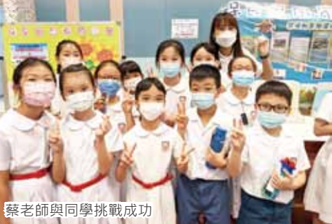
蔡老師與同學挑戰成功