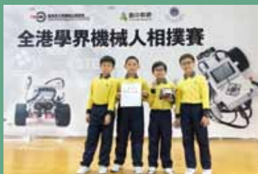
科學尖子參加全港學界機械人相撲賽