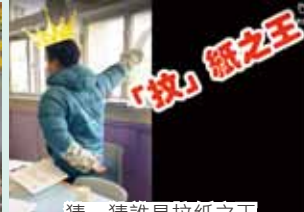
猜一猜誰是拉紙之王