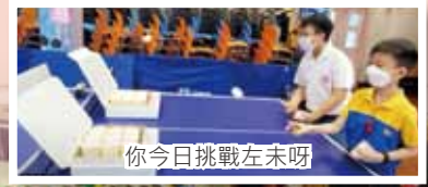
你今日挑戰左未呀