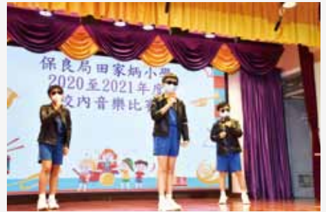
同學於歌唱組賽事載歌載舞，場內氣氛熱烈。