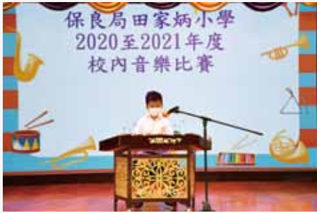
同學於演奏組賽事演奏揚琴，演出精彩。