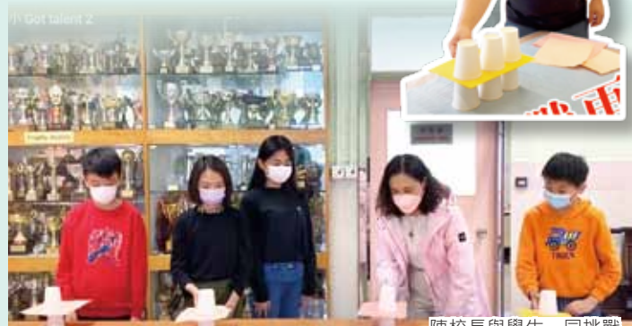
陳校長與學生一同挑戰